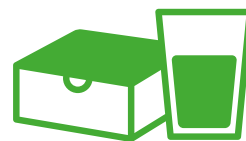
APERITIVO GOURMET A BORDO