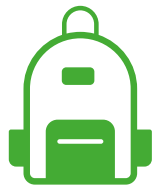
BOLSO DE MANO

Queremos que tus viajes empiecen y terminen con una gran sonrisa. Por eso te ofrecemos un servicio especial y personalizado incluido en cualquier tarifa que, entre otras, contiene las siguientes ventajas: