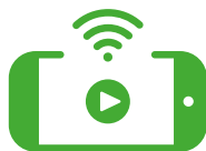
ENTRETENIMIENTO A BORDO